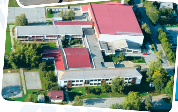
Srednja škola Ivanec