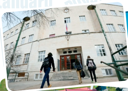
Ekonomista škola Šibenik

Glavna ciljna skupina našeg projekta je 60 učenika 3. i 4. razreda usmjerenja Ekonomist u Srednjoj školi Ivanec i Ekonomskoj školi Šibenik te 14 nastavnika ekonomskih grupa predmeta obiju škola. Smatramo kako širu korist od projekta kao krajnji korisnici imaju i naše šire lokalne sredine, odnosno svi učenici koji bi željeli u budućnosti upisati našu školu, smjer Ekonomist.