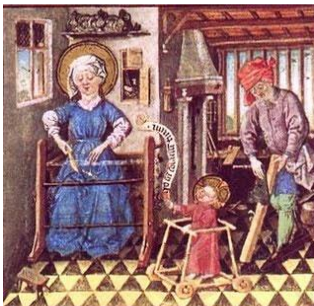
Slika 4. Prikaz kućanskim poslova

(Matotek, Višnja. 2014. „Ljubav i brak u srednjem vijeku.“ Hrvatski povijesni portal . https://povijest.net/ljubav-i-brak-u-srednjem-vijeku/ . Učitano 9. 5. 2020.)