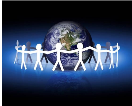
Slika 5. Povezanost ljudi globalizacijom

Globalizacija je proces povezivanja i prožimanja svijeta na gospodarskom, društvenom i političkom području. Za razliku od nekadašnjeg svijeta i malih odvojenih gospodarstava, suvremeni je svijet prerastao u jedinstveni gospodarski sustav. U tome su najveću važnost imali razvoj prometa i međunarodne trgovine. Promet se ubrzano počeo razvijati tijekom 20. stoljeća bivajući sve brži i jeftiniji. Rastu međunarodne trgovine pridonijeli su razvoj prometa, primjena novih tehnologija u trgovini, smanjenja i ukidanja carina koje su „smetale“ takvoj trgovini.