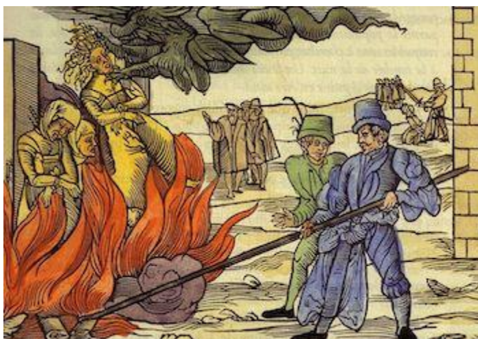
Slika 3. Paljenje žene na lomači

(„Inkvizicija (prvi dio).“ Portal za škole . http://www.skole.hr/dobro-je-znati/osnovnoskolci?news_id=18778 . Učitano 15. 5. 2020.)