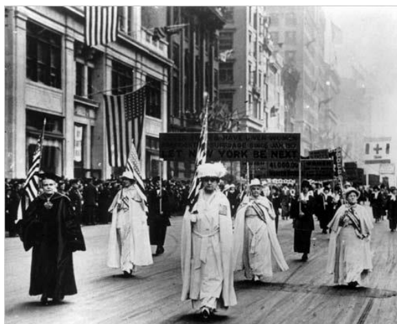
Slika 6. Prvi skup o ženskim pravima 1848. godine

posjeduju veći dio političke, ekonomske i religijske moći i autoriteta, a u većini zemalja razlike u položaju, moći i utjecaju muškaraca i žena su drastične, što je karakteristika patrijarhalnih društava. 11