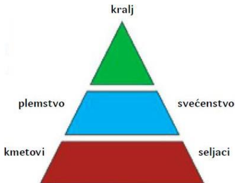
Slika 2. Podjela vlasti u srednjem vijeku

Feudalno je društvo obilježilo srednji vijek te se kao društveno uređenje nastavilo razvijati i u novom vijeku. Temelj ovog društva bio je zemljišni posjed zvan feud prema kojem je i ovo društveno uređenje dobilo naziv feudalno društvo ili feudalizam (lat. feudum – uređeni zemljišni posjed, leno). Tada se javljaju novi društveni odnosi poput feudalac – kmet i međusobne veze kao što je senior – vazal. 2 Feudalci su bili vlasnici zemljišta, a kmetovi su im obrađivali zemlju i davali dio uroda tzv. feudalnu rentu kako je bilo dogovoreno; uglavnom je to bila devetina ukupnog uroda. Renta je mogla biti radna, naturalna i novčana. Radnom se rentom kmet obvezao da određen broj dana u godini radi na alodiju. Naturalnom rentom je kmet bio dužan feudalcu davati dio proizvoda s posjeda. Razvojem trgovine, kmet je umjesto proizvoda feudalcu davao novac što se zvalo novčanom rentom. Senior – vazal je bila doživotna veza između moćnije osobe (senior) i slabije (vazal). Senior bi vazalu pružao zaštitu te mu osiguravao osnovne životne potrebe (hranu, odjeću, kuću, zemljišni posjed...), a vazal bi mu zauzvrat izvršavao brojne usluge koje bi senior od njega zatražio; ponekad je u to bila uključena i vojna služba.