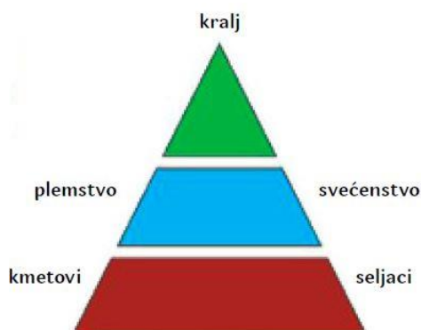
Slika 1. Podjela društva u srednjem vijeku (Srednjovjekovno društvo- seljak, plemić, građanin. E sfera. Školska knjiga. 2020. https://www.e-sfera.hr/dodatni-digitalni-sadrzaji/cdec9812-b40b-418b-b0f5-0da71d155127/ Učitano: 30. 4. 2020.)

Nakon pada Zapadnog Rimskog Carstva (476.) u srednjem vijeku počinje prevlast rodovsko-plemenskog društva koje živi seoskim načinom života. 1 Društvo je bilo podijeljeno na tri dijela: plemstvo, svećenstvo i seljaštvo (Slika 1.). Seljaštvo je činilo većinu u svim europskim zemljama, ali s obzirom da ih je bilo najviše, oni su posjedovali najmanje posjeda i često su radili na tuđim. 2 Temeljem novog društva postao je posjed koji se nazivao feud , a novo uređenje prozvalo se feudalizmom . Pojavom feudalizma, pojavljuju se i novi društveni odnosi – odnos feudalac i kmet ili senior i vazal.