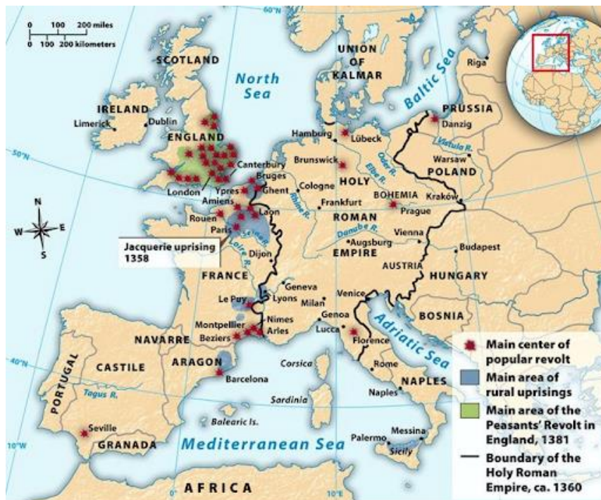
Map 12.3 Fourteenth-Century Peasant Revolts Chapter 12, A History of Western Society , Tenth Edition Copyright © 2011 by Bedford/St. Martin's Page 360

Karta 2. Jacquerie i ustanak Watta Tylera- glavne zahvaćene regije (Week 3 Catastrophes. http://users.rowan.edu/~mcinneshin/111/week03.htm Učitano: 10. 5. 2020.)