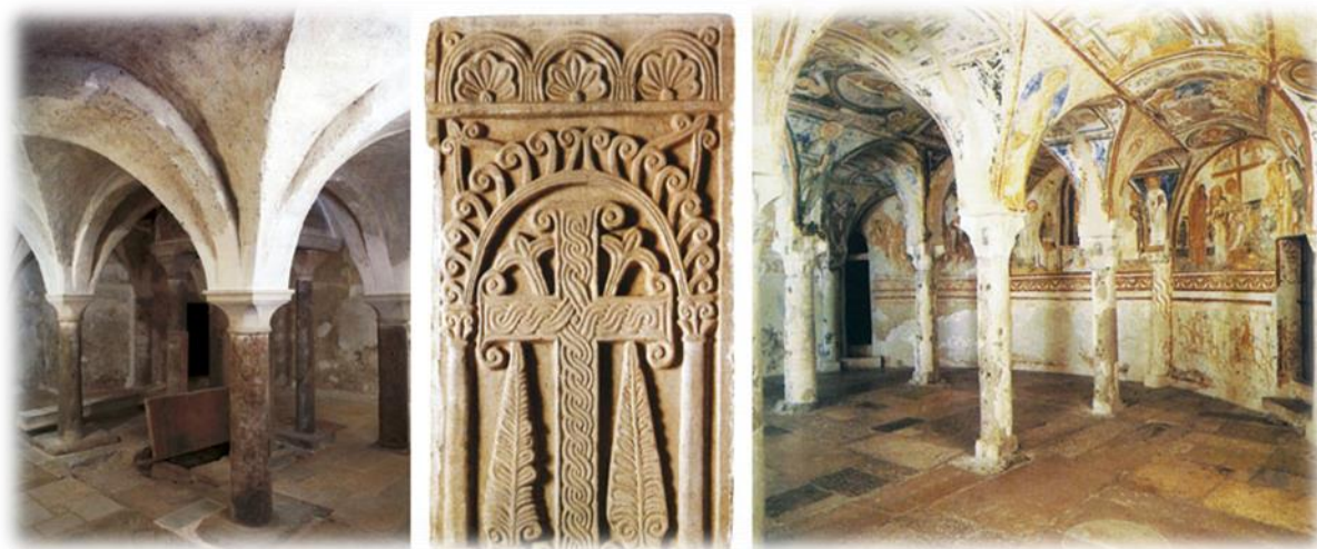
Slika 2. Usporedba kripte Novigradske katedrale (lijeva slika) i kripte katedrale u Akvileji (desna slika)