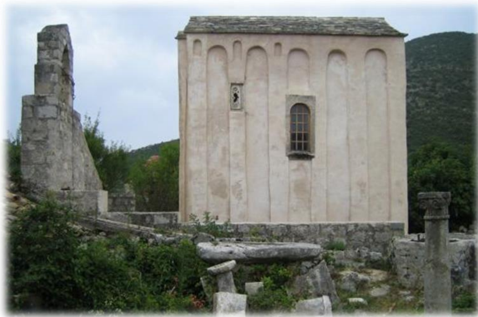
Slika 8. Crkva sv. Mihajla u Stonu

Izvor: http://old.dubrovniknet.hr/novost.php?id=36976#.XrljI2gzZPY . Učitano 11. svibnja 2020.