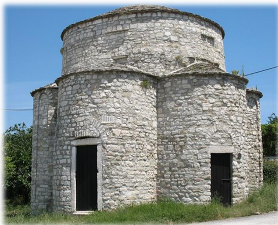
Slika 7. Crkva sv. Trojice