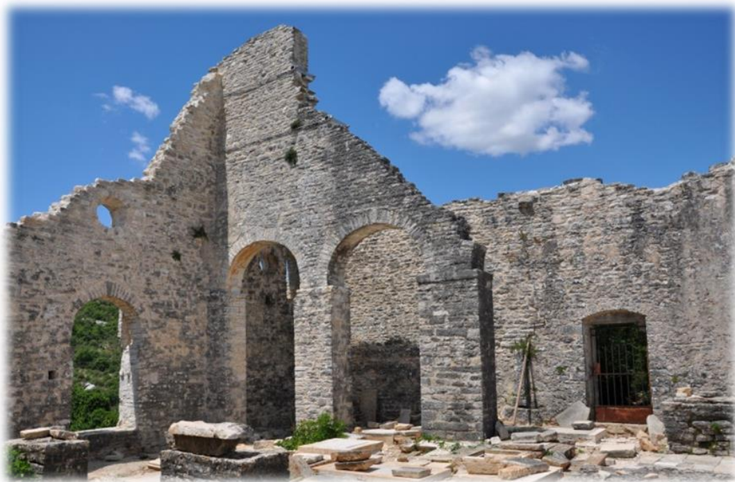
Slika 1. Crkva sv. Sofije u Dvigradu