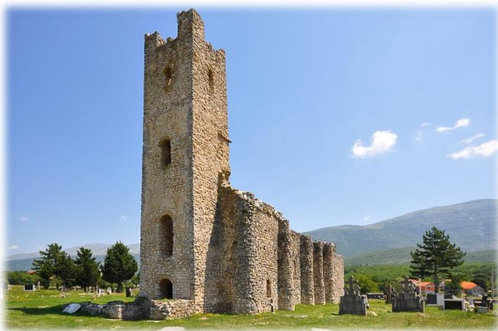
Slika 3. Crkva Sv. Spasa na vrelu Cetine