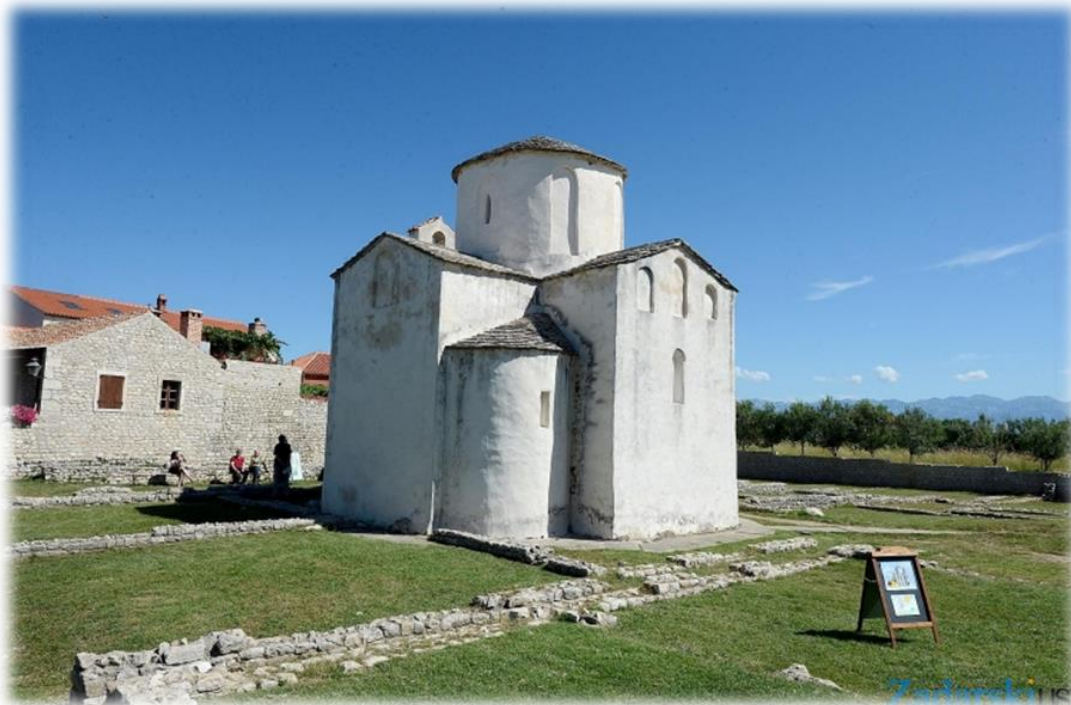
Slika 5. Crkva Sv. Križa u Ninu