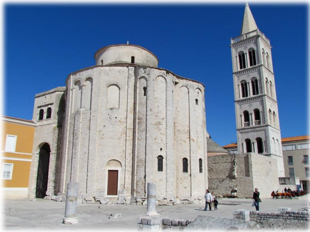
Slika 4. Crkva sv. Donata u Zadru

Izvor: https://www.flickr.com/photos/twiga_swala/5982568952 . Učitano 11. svibnja 2020.